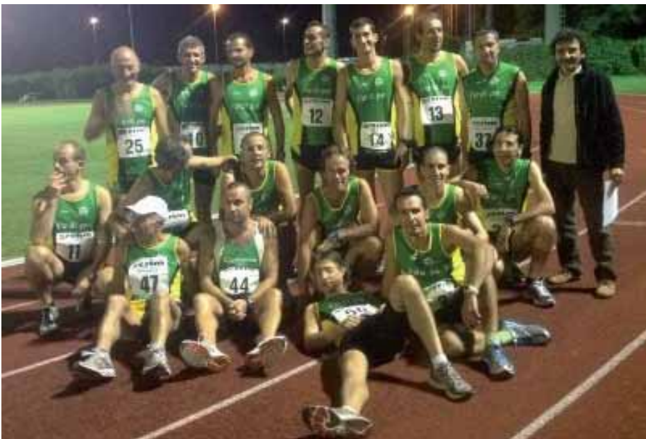
Foto di gruppo prima della partenza dei 10000 metri (svoltasi venerdì 14 settembre a Cassano d'Adda)